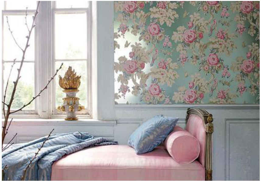
Рис. 1. Інтер'єрні рішення в стилі «романтизм»