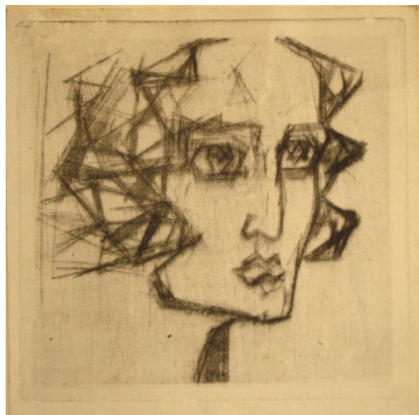
Рис. 4. Голова суму. 1913