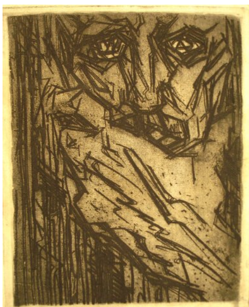
Рис. 5. Страх. 1913