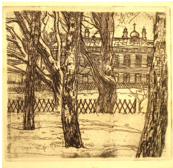
Рис. 2. Москва. Бульвар. 1912