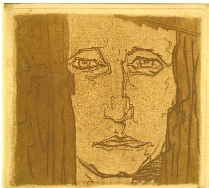
Рис. 6. Портрет матері. 1913