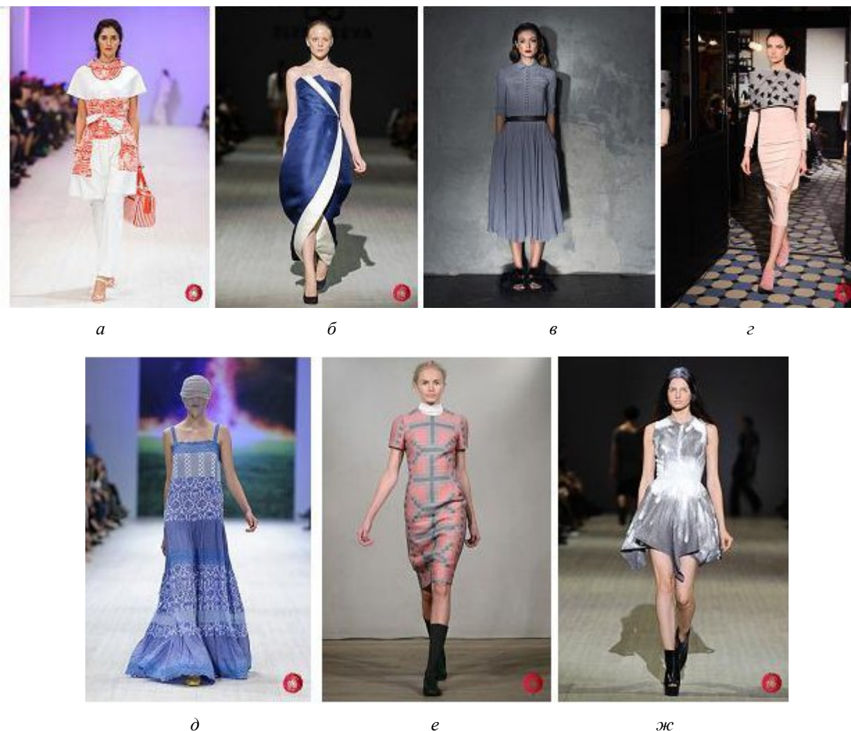
Рис. 2. Зрительные иллюзии в коллекциях украинских дизайнеров 35 UFW [6]

4. Выявление взаимосвязи отделки и зрительных иллюзий, возникающих в результате применения разных отделок в одежде, позволило разработать новые подходы к классификации видов отделки как графического средства зрительного восприятия на общем объеме изделия по критериям «линия–пятно–силуэт».