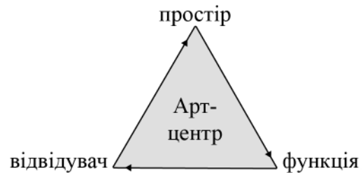
Рис. 1 Взаємозв'язок основних елементів мистецького центру

Виклад основних матеріалів дослідження. Вперше питання поведінки відвідувачів у музейному просторі розглядалися на початку ХХ ст. американською асоціацією музеїв. Дослідження проводилося лише з точки зору психології, проте психологічні процеси людей визначались під впливом характеристик самих експозиційних предметів, зокрема увага приділялася розміру, розташуванню, контексту експонатів, які могли підвищити або знизити рівень інтересу до них [11]. Згідно з А. Мелтоном, який одним із перших описував типи циркуляції, більшість відвідувачів, а саме 70–80 % з них, при вході в музейний експозиційний простір повернуть праворуч та пройдуть по правому боку виставки [10: 6]. Ще однією особливістю було те, що, незалежно від характеру експонатів та вистав-