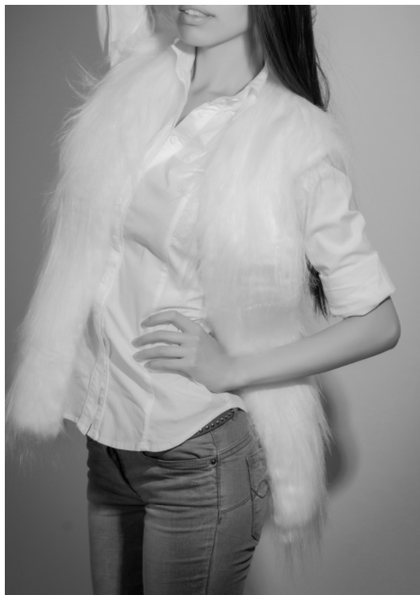
Рис. 1. Приклади вбрання «casual»

числі і в одязі, варто звернути увагу, що потяг до свободи, демократизму і комфорту матеріалізується в костюмі. Цей прояв ясно виражається у стильовому напрямі casual , який сьогодні є домінуючою модною тенденцією. Незважаючи на його широке поширення, він доволі молодий, але для кращого розуміння слід глибше його розглянути і простежити етапи його розвитку, що надасть змогу усвідомити межі впливу та подальших змін.