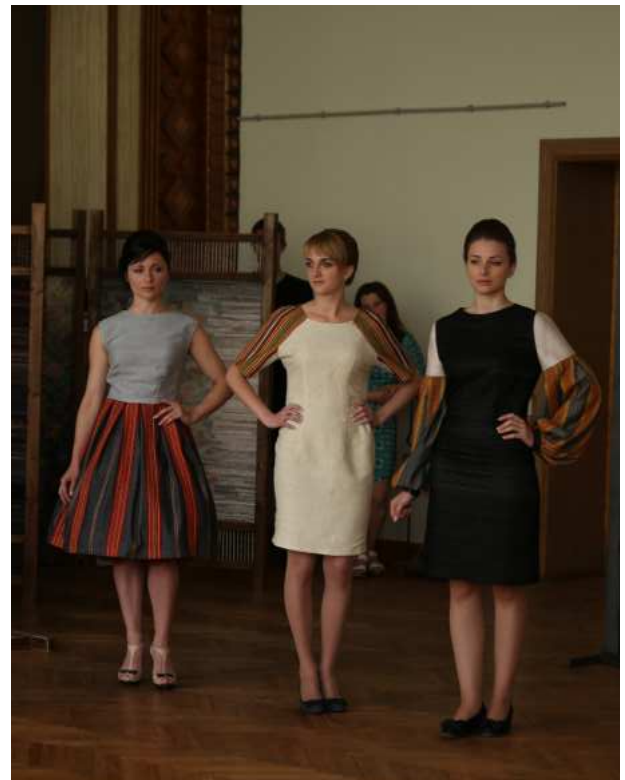
Рис. 4. Колекція одягу, розроблена на основі народного строю Гуцульщини