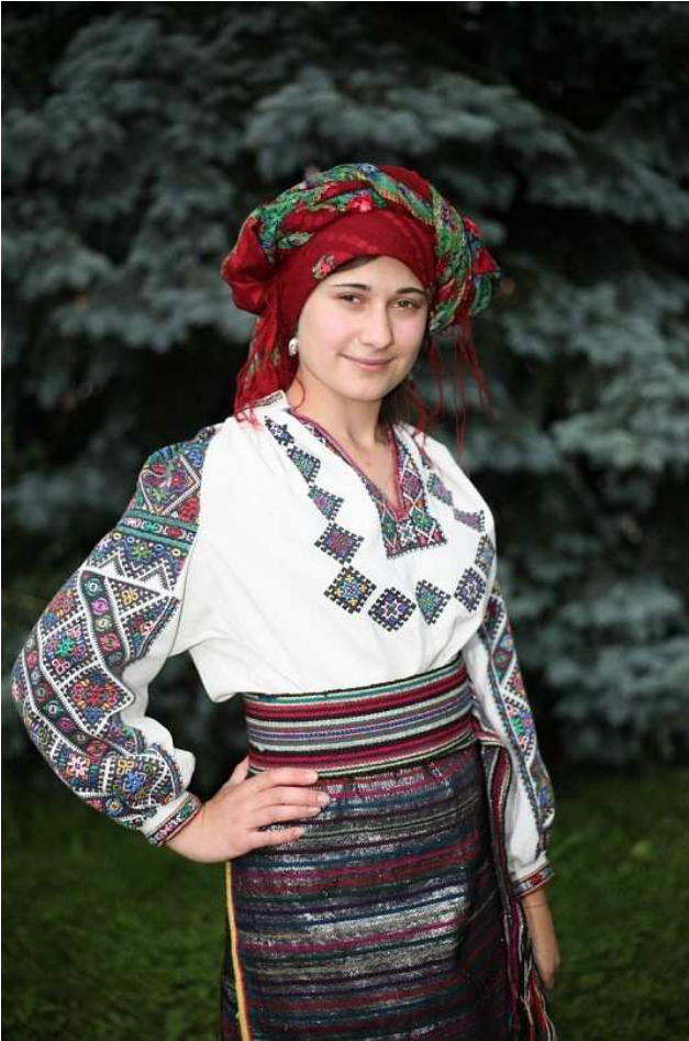
Рис. 1. Жіночий гуцульський стрій з Верховини