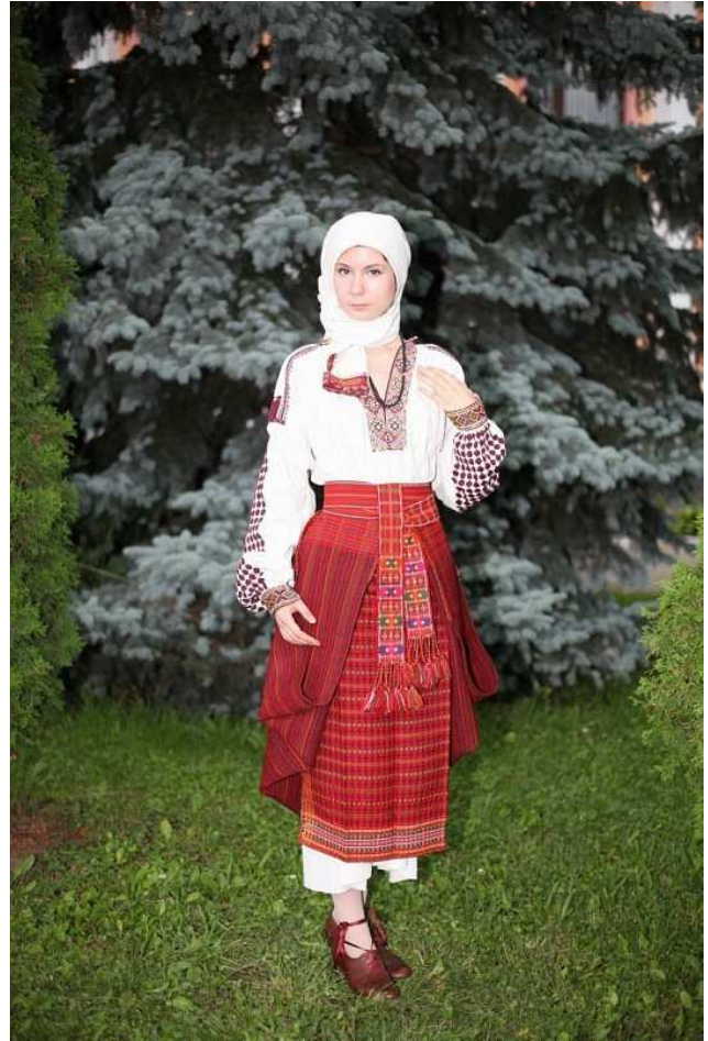
Рис. 2. Жіночий стрій Покуття (фото Р. Печижака)