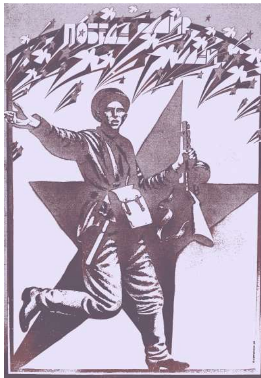
Іл. 2. В. Шевченко. Плакат до дня Перемоги. 1984 р.