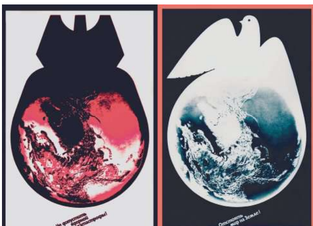
Іл. 4. В. Шевченко. Диптих «Мир тобі, Земле!». 1982 р.