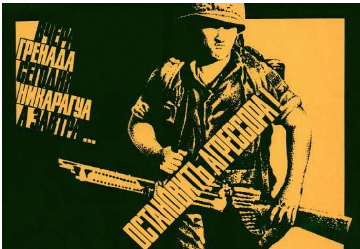
Іл. 1. В. Шевченко. Політичний плакат «Зупинити агресора». 1985 р.