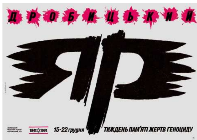
Іл. 5. В. Шевченко. Плакат «Дробицький Яр». 1991 р.