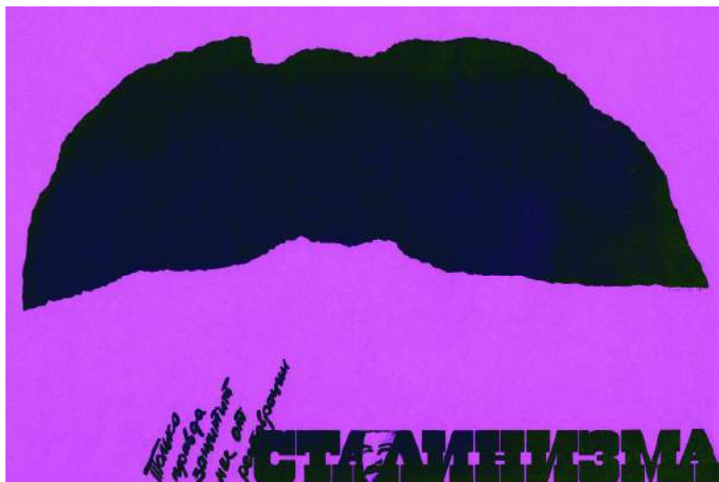
Іл. 6. В. Шевченко. Плакат «Тільки правда захистить нас від реставрації сталінізму». 1989 р.