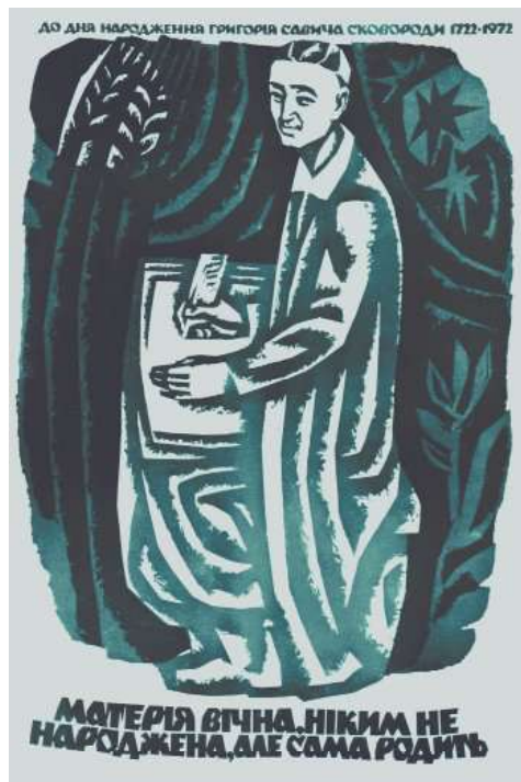
Іл. 7. В. Шевченко. Із серії плакатів до ювілею Григорія Сковороди. 1972 р.