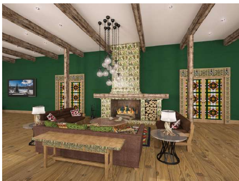
Рис. 3. Аріна Корякіна. Тривимірна модель зони каміну