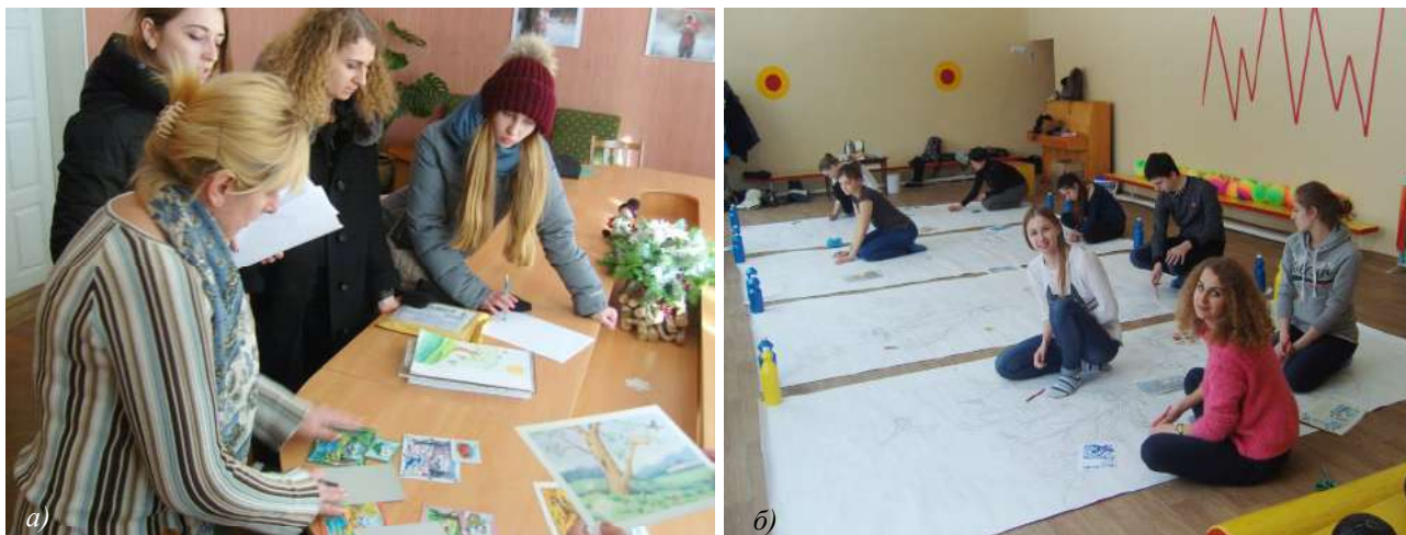
Рис. 1. Участь студентів спеціальності «Дизайн» у соціальному проекті «Кольоровий світ»: а) обговорення проекту за схемою «дизайнер — виробник — споживач»; б) студенти за своїми творчими пропозиціями