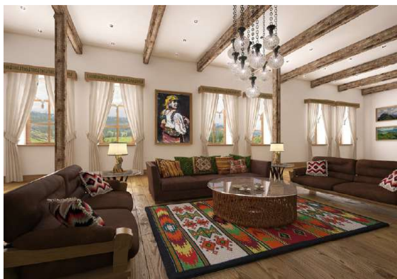
Рис. 4. Аріна Корякіна. Тривимірна модель зони каміну (центральна частина)