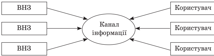
Рис. 2. Модель комунікації «багато до багатьох»

Так, сучасний стан інформаційно-комунікаційного простору якісно відрізняється від його стану в попередні роки і навіть у першій половині ХХ ст., оскільки сьогодні потенційну глобальність отримує будь-яка інформація, яка «потрапляє» у світову телекомунікаційну та комп'ютерну мережу. Комунікація у ВНЗ забезпечує рух навчальної інформації в часі та просторі за допомогою створення, зберігання та розповсюдження навчальних документів не лише в паперовій формі, а й в електронній завдяки розвиткові нових ІКТ.