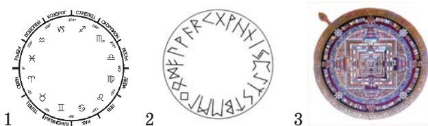
Рис. 2. Складні та макроскладні графічні знаково-символьні системи (1. Астрологічна система (12 символів). 2. Рунічна система (24 символи). 3. Мандала Тибету як макроскладна графічна знаково-символьна система (50 символів і більше).

Складні й макроскладні символні системи характеризуються взаємозв'язком між елементами, циклічністю, динамічністю внутрішніх процесів, семантичною, синтаксичною та прагматичними складовими, які утворюють емерджентну якість — цілісність символу — і забезпечують узагальнююче символічне значення. Складні графічні системні символи поділяються на групи: дванадцять астрологічних символів — на 4 групи за видами стихій; рунічна знаково-символьна система — на 3 групи по 8 знаків-символів. Мандала — це макроскладна графічна система впорядкованих і взаємопов'язаних символів; кожен елемент цієї системи містить певну інформацію, зашифровану у формі та кольорі. Слово «мандала» означає «сакральне коло»;