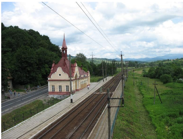
Рис. 13. Пасажирська станція Карпати