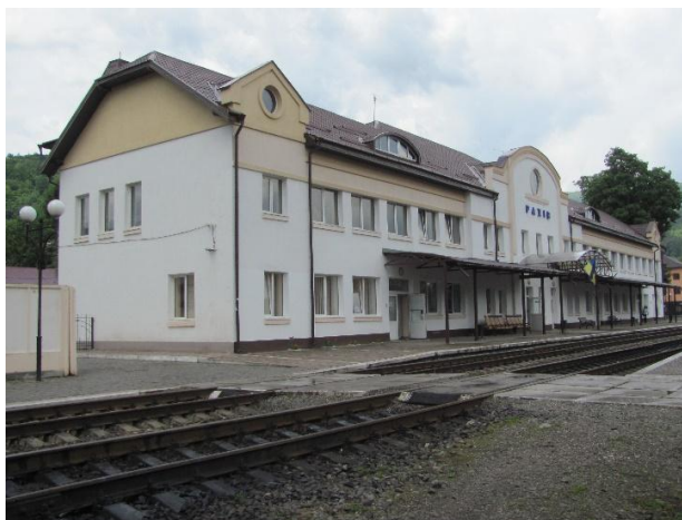
Рис. 11. Вокзал Рахів