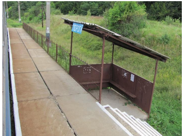
Рис. 18. Пасажирська споруда Пороги