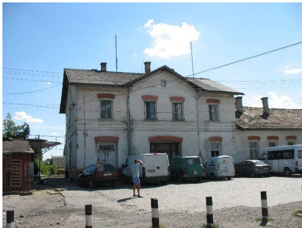
Рис. 1. Вокзал Виноградово-Закарпатське

замку, демонстративні пишноти інтер'єру зі скульптурною композицією посеред залу та відкритого музейного кутка Г. Кири у головному залі притримують епоху постмодернізму та пострадянськості (рис. 9, 10).