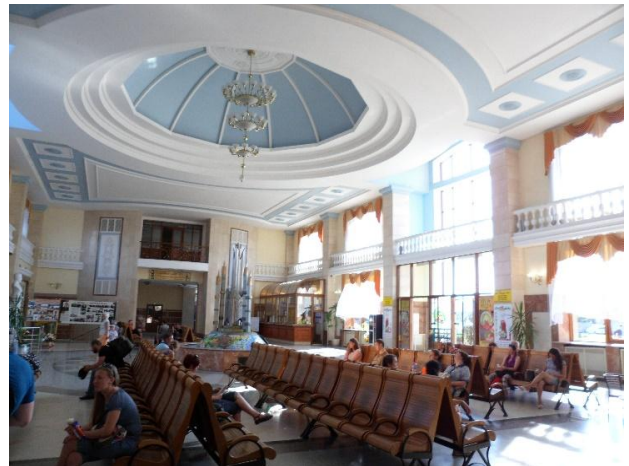
Рис. 10. Інтер'єр вокзалу Ужгород