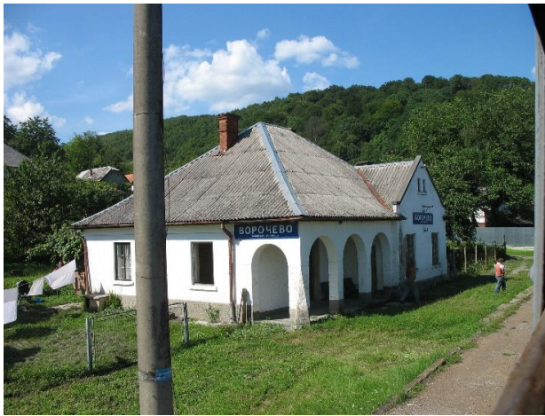
Рис. 15. Пасажирська будівля Ворочєво

до Бочкою Маре) відсутні віддавна. Візуально-інформаційний супровід, дизайн устаткування для користувачів потребують ґрунтового підходу та змін.