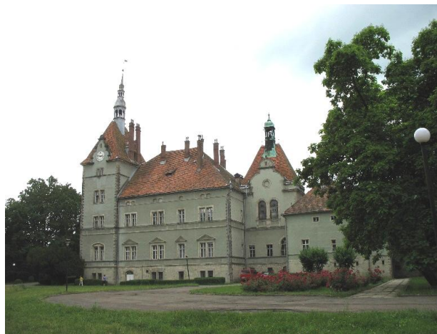
Рис. 14. Санаторій "Карпати", колишній палац Шенборнів біля Сваляви

Дуже характерними для залізниць Закарпаття є малі за розмірами типові вокзальні будівлі, які часом поєднують невеликий будинок зі спади́стими дахами та навісом, арковою галереєю – Бедевля, Велика Копаня, Ворочеве, Грушово, Зарічево, Невицьке, Невицьке-Замок, Нове Село, Сіль, Сокирниця, Фанчиково, Цеглівка та ін. Асиметрична композиція не вражає помпезністю; створюється відчуття спокою, наближаючи вокзальний будівлю до архітектури житла (рис. 15, 16). Правдоподібно, вони взу́рвалися до пасажирської будівлі станції Карпати.