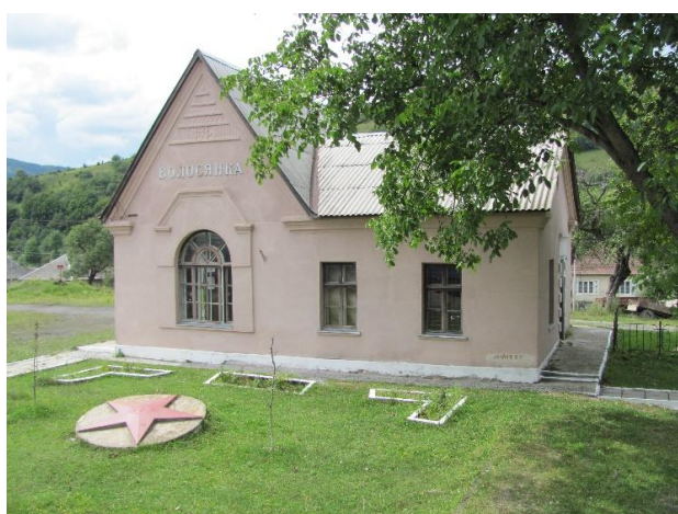
Рис. 5. Станц. будівля Волосянка-Закарпатська