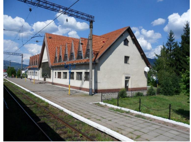
Рис. 8. Вокзал Великий Березний

Після воєнних руйнувань частина вокзалів не відновлювалася в історичному вигляді, а будувалася заново відповідно до вимог часу в інших архітектурно-пластичних формах. Вони виконувалися як окремо, так і за типовими проектами. До окремих треба зарахувати повоєнний вокзал у Ясині (рис. 11), недавно реконструйований у Рахові (рис. 12), а також давніші пасажирські будівлі, як от пасажирська