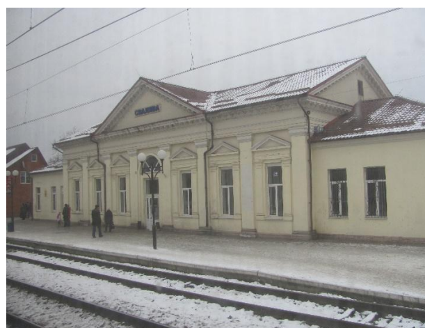
Рис. 4. Вокзал Свалява