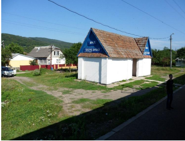
Рис. 7. Пасажирська будівля Малий Березний