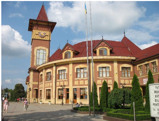
Рис. 9. Вокзал Ужгород

станція Карпати біля санаторію. Вокзальна будівля цієї станції виконана у стилістичних мотивах неподалік розташованого колишнього палацу графів Шенборнів (Schönborn) попереднього зламу століть біля Сваляви, у якому зараз розміщено санаторій "Карпати". Це є рідкісний приклад ансамблевого стилістичного виконання різнофункційних архітектурних об'єктів (рис. 13, 14).