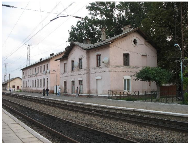
Рис. 2. Будівлі станції Батьово