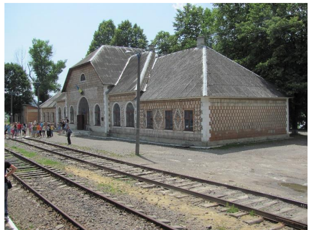
Рис. 12. Вокзал Ясиня