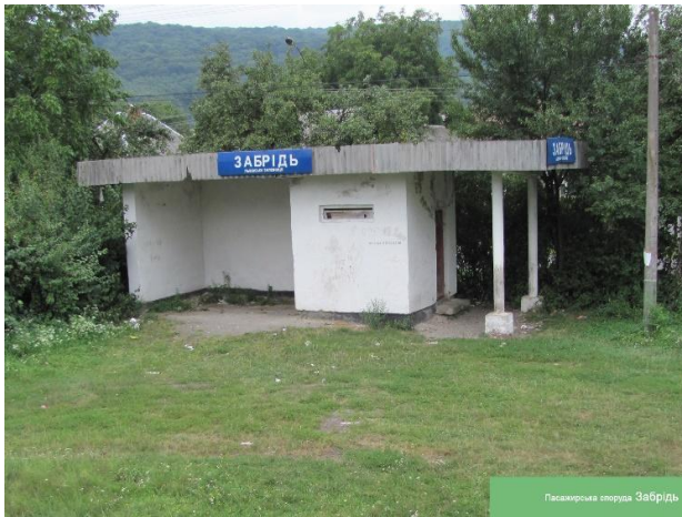
Рис. 17. Пасажирський павільйон Забрїдь