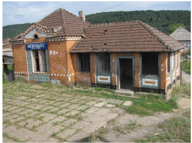
Рис. 16. Пасажирська будівля Нєвицькє