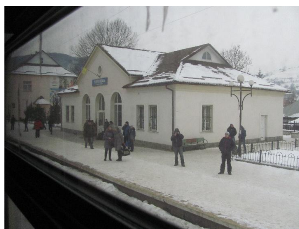
Рис. 6. Вокзал Воловець