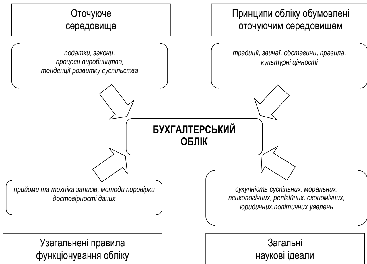
Рис. 2. Фактори впливу на розвиток бухгалтерського обліку*

У кожній із цивілізацій відбувався процес становлення та розвитку обліку, який виник з банальних потреб матеріального виробництва та досяг рівня наукового знання. Історично на розвиток процесу обліку впливали фактори зображені на рис. 2.