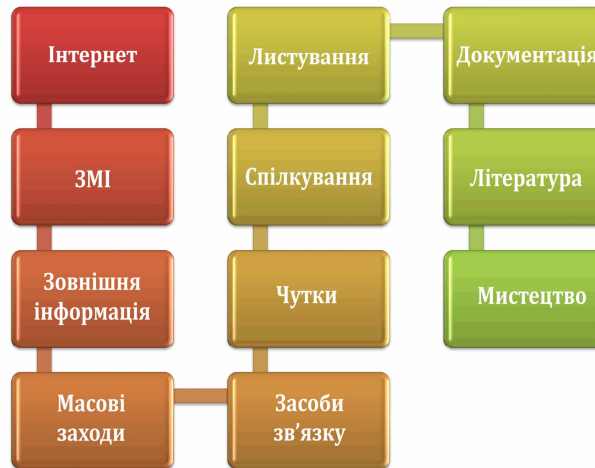
Інфографіка 3 – Комунікативні канали

1 Кадрова робота на рівні представників влади. Моральність, відкритість та комунікабельність представників держави закладуть хорошу основу для взаємної довіри.