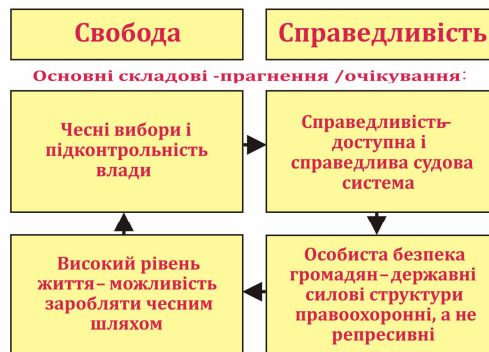
Інфографіка 1 – Національна ідея