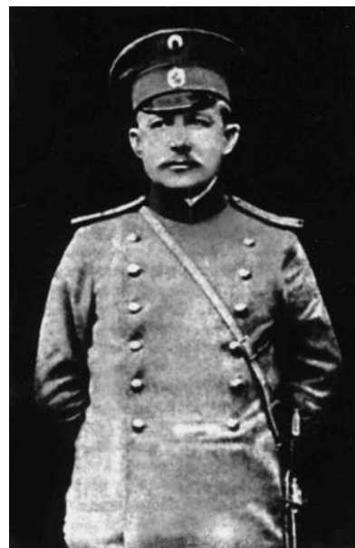
Полковник М. О. Красовський – начальник «Інформбюро» Генерального штабу збройних сил УНР (фото 1911 року)

А виховувати належить громадянина – патріота незалежної Української держави, готового в разі необхідності стати на її захист зі зброєю в руках.