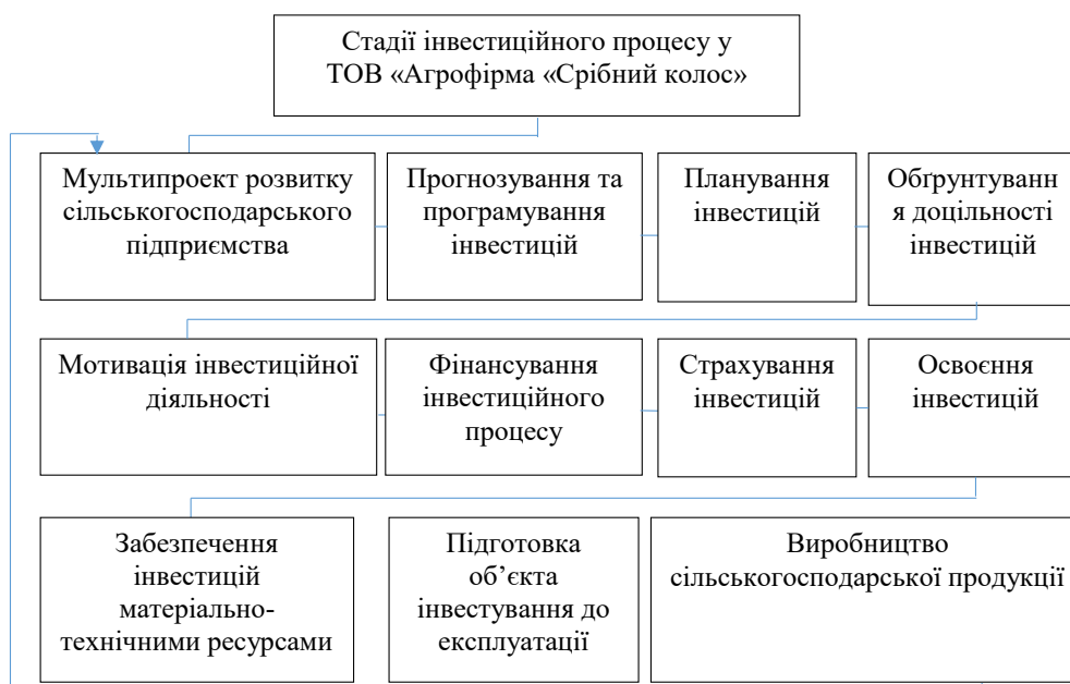
Рис. 2. Основні стадії інвестиційного процесу у ТОВ «Агрофірма «Срібний колос», 2014-2018 рр.

Однією з головних причин кризи виробництва й інвестиційного процесу в сільському господарстві є послаблення ролі держави в регулюванні виробничих економічних відносин і, насамперед,