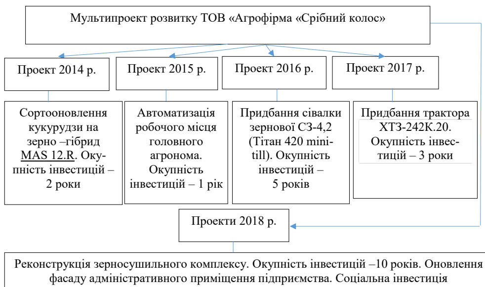
Рис. 3. Сукупність проектів розвитку ТОВ «Агрофірма «Срібний колос», 2014-2018 рр.