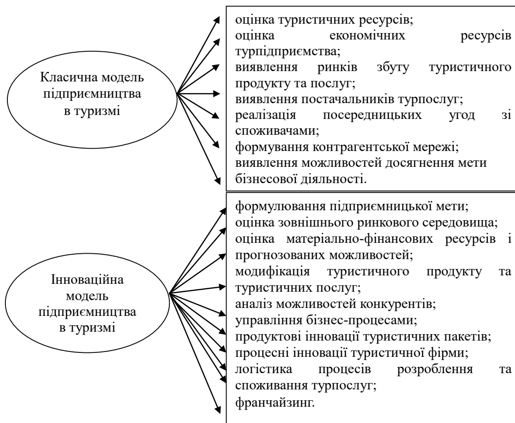
Рис. 1. Типологічна модель підприємництва в туристично-рекреаційній сфері

Аналізуючи форми підприємництва на національному та регіональних ринках, для формування підприємницької концепції туристичного бізнесу нами пропонується поширити класичну та інноваційну моделі підприємництва з альтернативними варіантами їх поєднання за складовими економічними елементами підприємницької концепції (рис. 1).