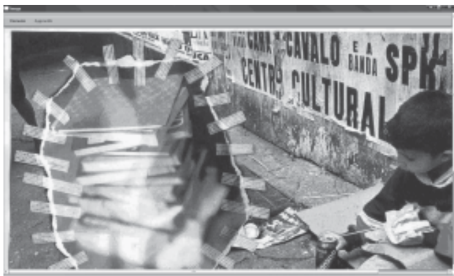
Рис. 1. Зорова реклама як опора вправи у написанні власного рекламного тексту

Consigne: En vous inspirant de la pub “ Nous avons le monde à soigner ” rédigez votre texte publicitaire en exprimant les souhaits et la nécessité.