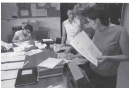
La salle des professeurs