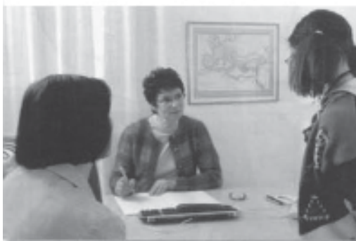
Le bureau de la principale