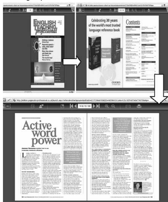
Рис. 1. Почерговість знаходження необхідної сторінки в методичному електронному журналі English Teaching Professional у форматі виключно для читання в режимі он-лайн.

Task. Type the address in http://edition.pagesuite-professional.co.uk/ in the address line and look through the journal. Write down the headings of 5 articles which might be useful in teaching English at a higher educational establishment. Discuss your suppositions in group.