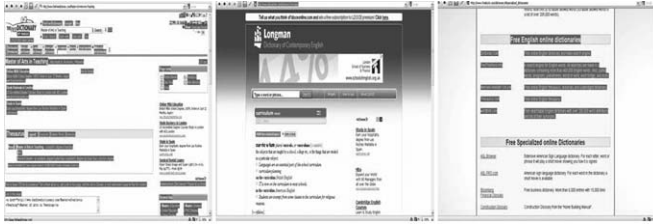
Рис. 2. Приклади сайтів електронних словників з наявними в них лінками.

Task. While reading a scientific article on ELT or pedagogy you've come across some unknown word expressions which prevent you from understanding the meaning. Find some free on-line English-English and English-Ukrainian/Russian Dictionaries and browse them with the links. Discuss in group which dictionaries are more efficient to use.