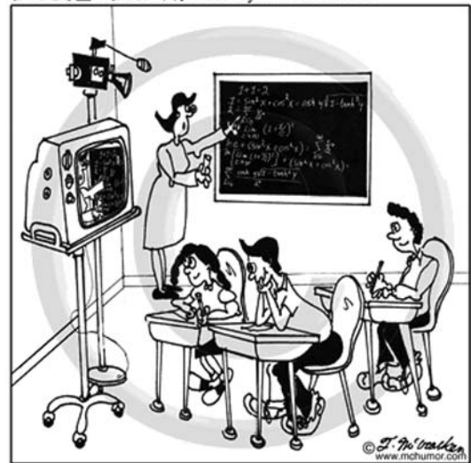
Employing technology to keep students' attention.