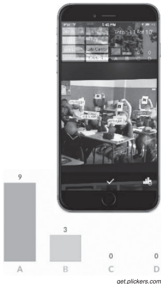
Рис. 4. Сканування в «Plickers» камерою мобільного пристрою вчителя відповідей учасників

Коли відповіді всіх учнів проскановані, учитель натискає на «пташечку» в нижній частині екрана мобільного пристрою, щоб завершити сканування, і повертається до наступного питання, повторюючи процедуру сканування.