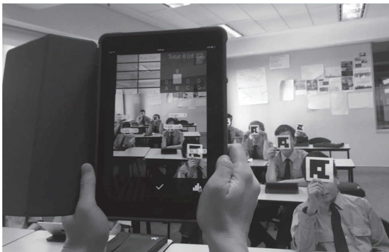
Рис. 2. Учитель у додатку «Plickers» на мобільному пристрої зчитує відповіді класу