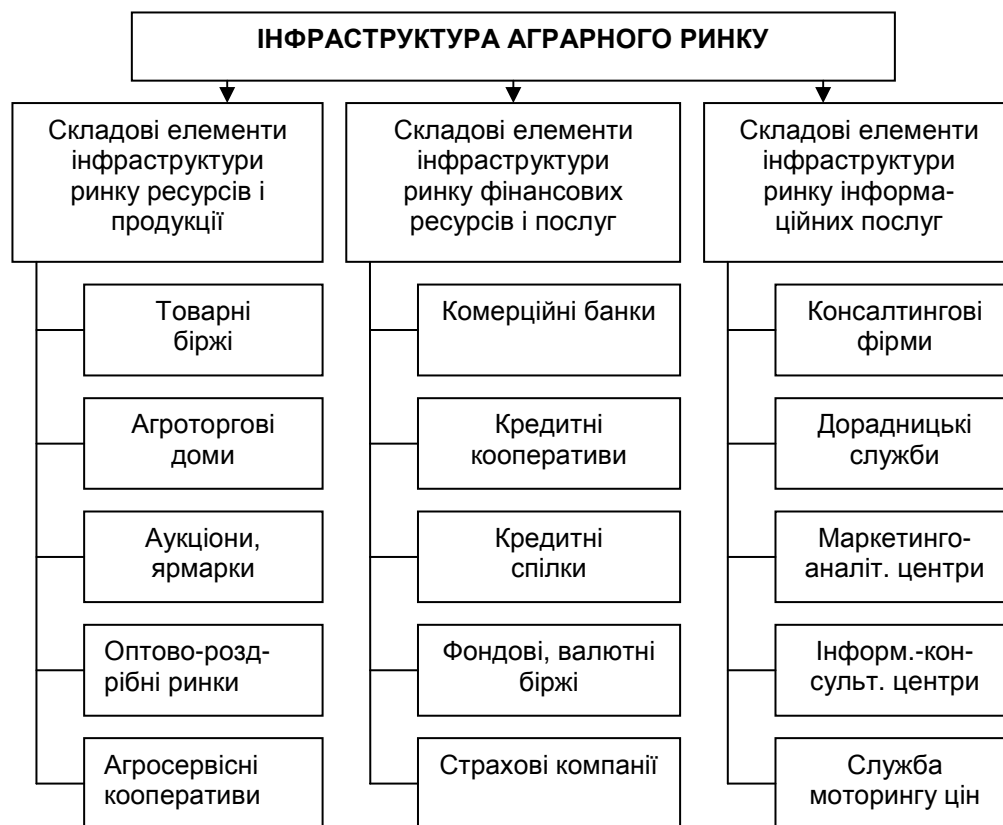
Рис. 1. Інфраструктура аграрного ринку

матеріальну базу – складське і тарне господарство, транспортні системи; інформаційну базу – інформаційні системи за споживачами, виробниками, цінами, банківськими послугами; кредитно-розрахункову базу – банківські і страхові установи, фінансові інвестиційні компанії; кадрову базу; нормативно-правову базу – норми і правила, що регламентують відносини суб'єктів ринкового господарства в процесі реалізації товарів і послуг.