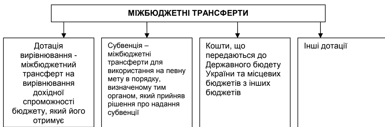
Рис. 1. Види міжбюджетних трансфертів