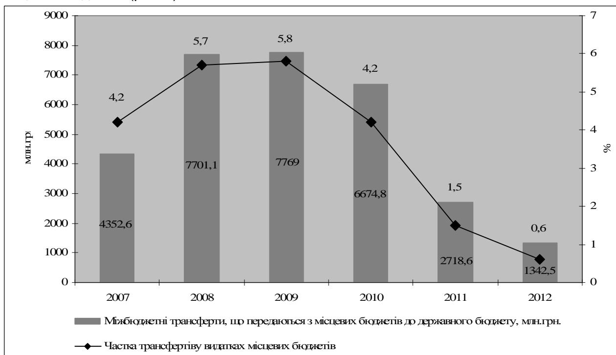
Рис. 4. Динаміка перерахування трансфертів із місцевих бюджетів до державного бюджету за 2007-2012 рр.

У цілому загальний обсяг трансфертів до державного бюджету склав 0,6% усіх видатків місцевих бюджетів (рис. 4).