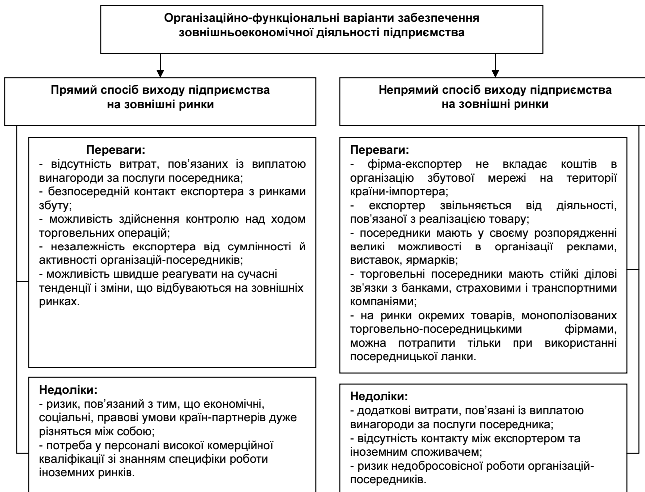
Рис. 1. Переваги та недоліки прямого і непрямих способів виходу підприємства на зовнішні ринки

У забезпеченні зовнішньоекономічної діяльності підприємства важливу роль відіграє економічна складова, яка здійснює суттєвий вплив на формування і функціонування організаційної складової. Водночас у практичній діяльності вони невіддільні одна від одної. Взаємопроникнення та взаємодія економічних та організаційних елементів формують організаційно-економічне забезпечення зовнішньоекономічної діяльності підприємства, що є важливою передумовою для підвищення ефективності господарювання загалом.