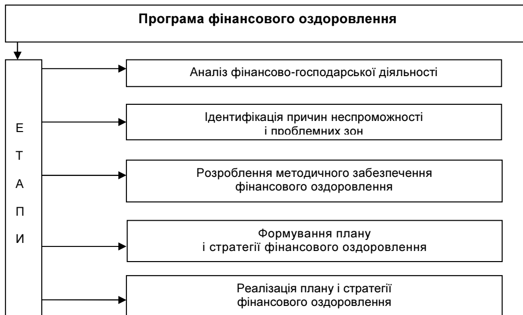
Рис. 3. Етапи фінансового оздоровлення підприємства

З метою зміни такого стану у аграрній сфері слід фінансове оздоровлення сільськогосподарських підприємств проводити поетапно (рис.3).