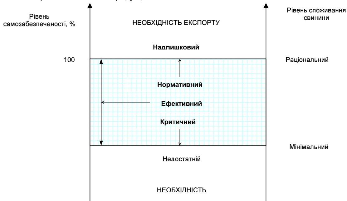
Рис. 2. Рівень самозабезпеченості власним виробництвом агропродовольчої продукції

Як видно з рис. 2, нормативний – це такий рівень самозабезпеченості власним виробництвом у відповідних видах агропродовольчої продукції, при якому її власне виробництво забезпечує внутрішнє споживання на виробничі потреби і особисте споживання населення, розраховане на основі раціонального рівня споживання продукції.