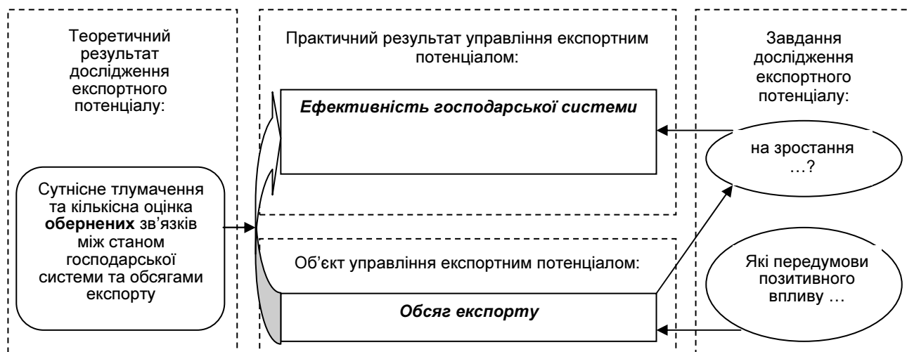
Рис. 2. Схема інструментального етапу дослідження експортного потенціалу господарської системи

Сучасна модифікація цієї позиції, з урахуванням структури ринку монополістичної конкуренції та її динамічної зміни, відображена в дослідженнях П.Кругмена та відзначена у 2008 р. Нобелівською премією з економіки. Реалізація вказаної просторово-орієнтованої позиції передбачає зосередження господарської системи на здобутті певної частки ринку, яка дозволить мінімізувати середні витрати виробництва. В узагальненій інтерпретації дослідження експортного потенціалу з даної позиції передбачає вивчення зворотних зв'язків між нарощуванням експорту та рівнем економічної ефективності господарської діяльності підприємств-експортерів. Таким чином, експортний потенціал розглядається як інструмент для підвищення ефективності господарської діяльності. Схематично інструментальна позиція відображена на рис. 2.