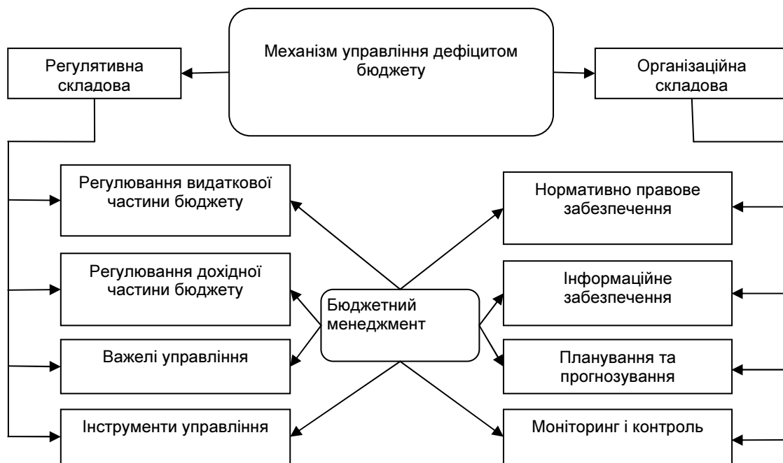
Рис. 2. Складові механізму управління бюджетним дефіцитом

Основними компонентами механізму управління дефіцитом бюджету є організаційна та регулятивна складові, представлені на рисунку 2. Організаційна складова включає нормативно-правове забезпечення, планування та прогнозування, інформаційне забезпечення, моніторинг та контроль. Регулювання бюджетного дефіциту відбувається шляхом регулювання доходної та видаткової частини бюджету за рахунок використання фінансових важелів та інструментів.