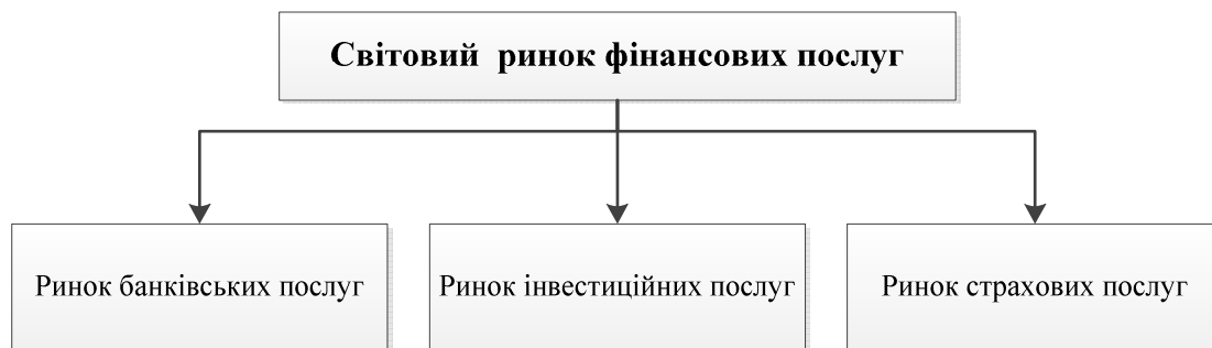
Рис. 1. Структура світового ринку фінансових послуг

Структура СРФП за видами послуг узагальнено може бути відображена так (рис. 1).