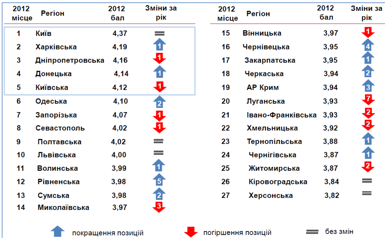
Рис. 1. Рівень конкурентоспроможності регіонів України у 2012 році