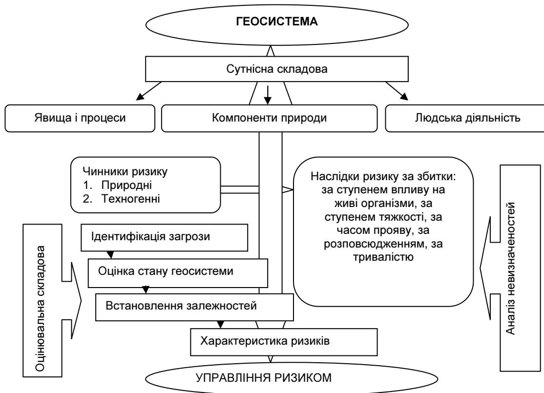
Рис. 1. Сутнісно-оцінювальний комплекс поняття «екологічний ризик»

Попри існування вище зазначених нормативних документів, значного збитку національному господарству та населенню завдає забруднення навколишнього середовища внаслідок антропогенної діяльності. У окремих регіонах, де проведено осушення земель, відбувається неконтрольоване зниження рівня ґрунтових вод, зменшення потужності органічної маси, а в районах зрошення, підтоплення і засолення ґрунтів, деградація чорноземів, що призвело до негативних екологічних наслідків у районах Полісся та на півдні України. Серйозної екологічної шкоди земельним ресурсам завдають викиди промисловості (важкі метали, кислотні дощі тощо) та використання засобів хімізації в аграрному секторі. Крім антропогенних причин порушення екологічного стану земель існують і більш серйозні та непередбачувані, такі як землетруси, урагани, обвали, зсуви, повені, паводки, буревії та вихори, зливи, град та інші. Теоретична сутність екологічних ризиків полягає у наступному (рис. 1).