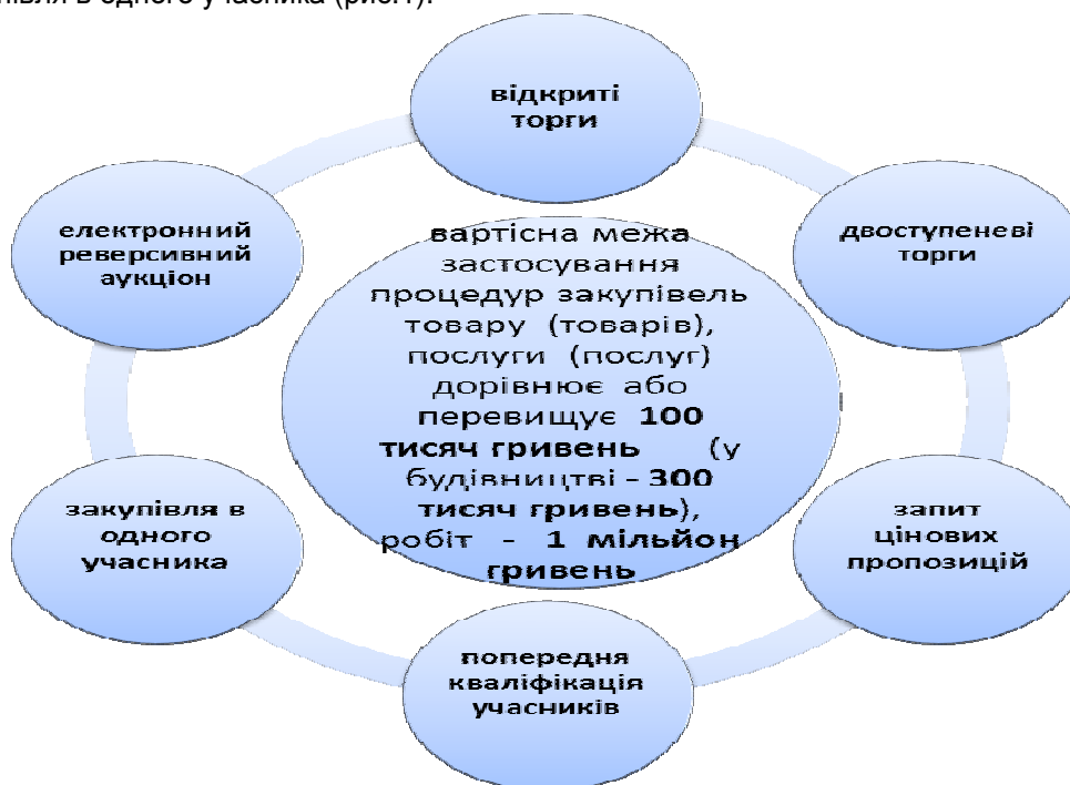
Рис. 1. Процедури здійснення державних закупівель