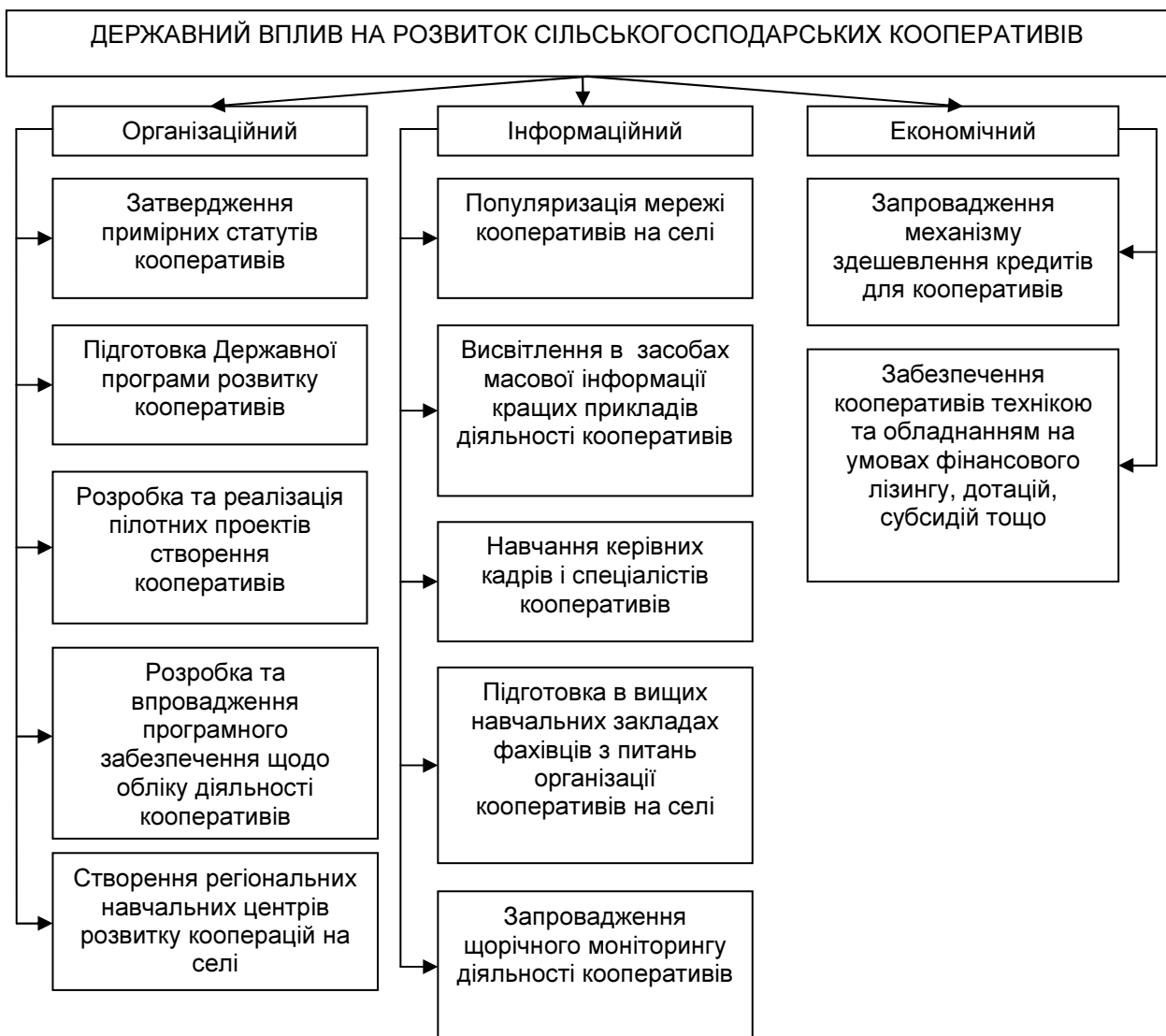
Рис. 2. Програмні заходи державного впливу на розвиток сільськогосподарських кооперативів в Україні*

Крім цього, не менш важливим концептуальним напрямом, на наш погляд, є розробка та ефективна реалізація комплексного механізму державного регулювання розвитку сільськогосподарських кооперативів (запровадження державної кооперативної політики, співпраця державних органів і самоврядних організацій) та оцінка результатів від його впровадження. Це можливо насамперед за умови визначення чітких програмних заходів державного впливу на розвиток сільськогосподарських кооперативів (рис. 2). Так, першим програмним заходом державного впливу на розвиток сільськогосподарських кооперативів є організаційний (затвердження нормативно-правової бази, Державних цільових програм, підготовчих центрів розвитку вищевказаних суб'єктів господарювання).