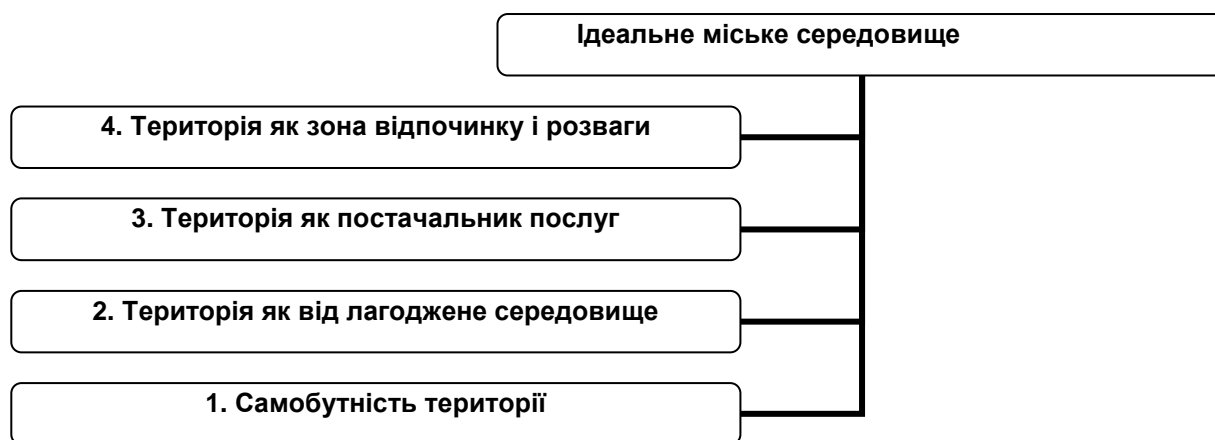
Рис. 2. Процес дослідження міського середовища

Виділяють чотири компоненти ідеального соціально-орієнтованого міського середовища, що може сприяти просуванню місту та допомагати жителям, туристам, гостям виявити несприятливу обстановку (рис. 2) [7].