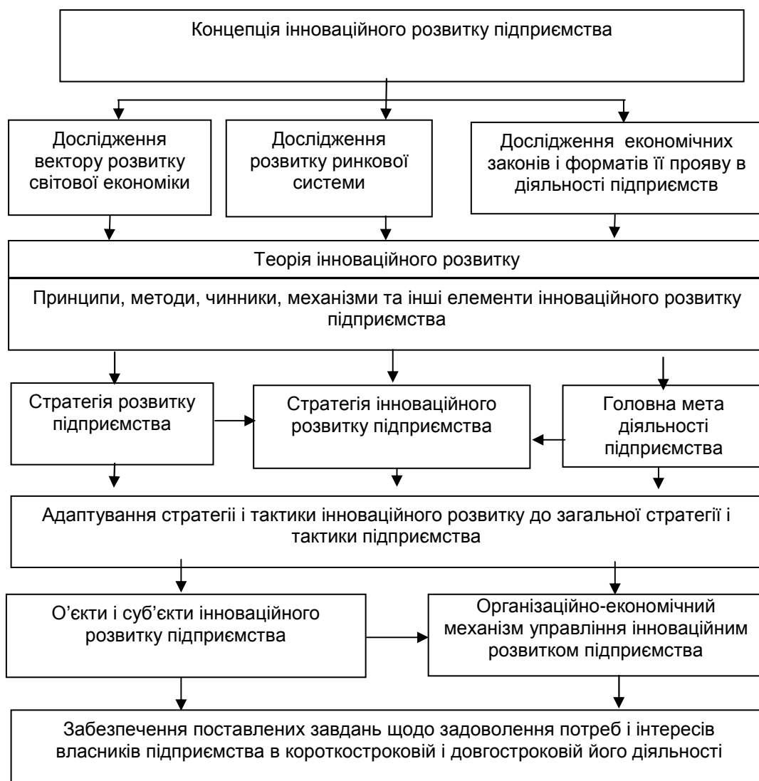
Рис. 3. Концептуальні засади щодо забезпечення інноваційного розвитку підприємства

Стратегія розвитку підприємства та головна мета його діяльності формують стратегію інноваційного розвитку підприємства, яка, в свою чергу, передбачає адаптування стратегії і тактики інноваційного розвитку до загальної стратегії і тактики підприємства.