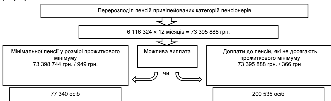
Рис. 2. Результати можливого перерозподілу пенсій найбільш незахищеним категоріям пенсіонерів

Пропозиції щодо скорочення й розподілу максимальних пенсій в розрахунку на рік наведено на рисунку 2.