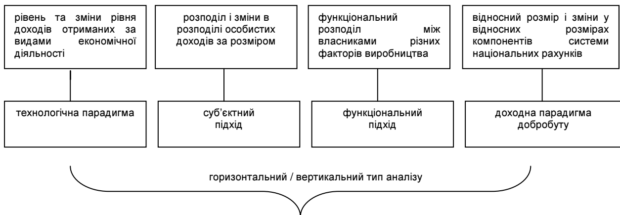
Рис. 1. Диференціація предмету дослідження теорії розподілу та підходів до їх аналізу