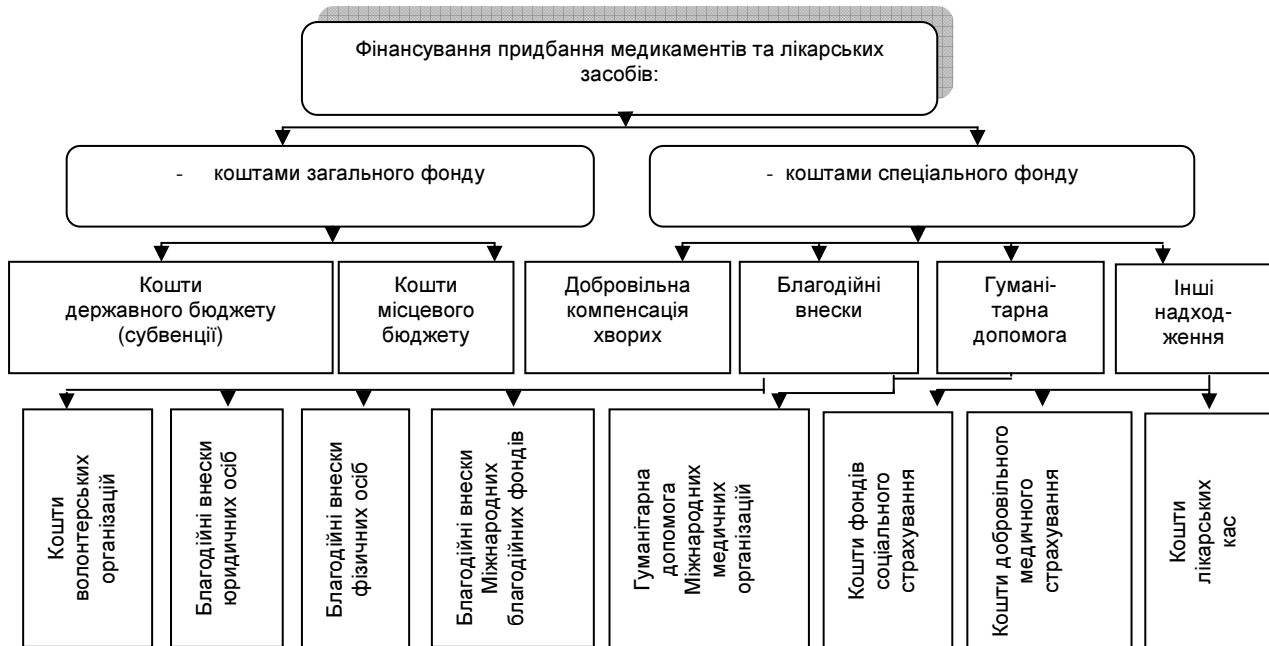
Рис. 1. Джерела фінансування придбання госпіталами та іншими закладами охорони здоров'я медикаментів та лікарських засобів в умовах надзвичайної ситуації

засобів здійснюється за кошти загального фонду (за кошти місцевого бюджету, а також за кошти державного бюджету у вигляді субвенцій, коштів програмно-цільового фінансування тощо) та спеціального фонду. В умовах надзвичайних ситуацій перелік джерел надходження медикаментів та лікарських препаратів за рахунок коштів спеціального фонду значно розширюється (рис.1).