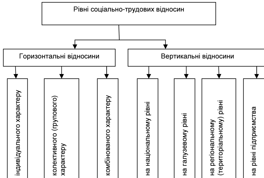
Рис. 1. Рівні соціально-трудоих відносин

Кожному рівню СТВ (рис. 1) притаманні свій специфічний предмет цих відносин, суб'єкти та взаємозв'язки між ними.