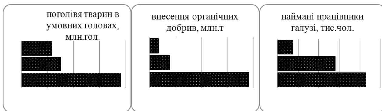
Рис.1. Основні показники результативності аграрної діяльності в Україні за період 1990-2013 рр.

Дивлячись на статистичні дані (рис.1) результативності аграрної діяльності України, помітне різке скорочення важливих показників. Зокрема, скоротилось поголів'я сільськогосподарських тварин ВРХ з 25194,8 тис. голів у 1990 р. до 4534,0 тис. голів у 2014 році, свиней з 19946,7 тис. голів до 7922,2 тис. голів відповідно. У зв'язку зі скороченням поголів'я скоротилося і внесення органічних добрив, які є основою покращення природної родючості ґрунту. Скоротилася також у більш ніж 4 рази і кількість зайнятого працездатного сільського населення.