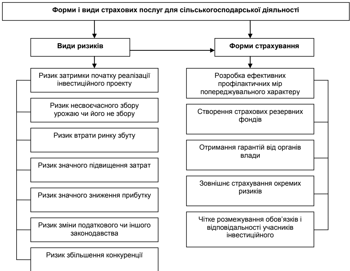
Рис. 2. Можливі форми і види обов'язкового страхування аграрної діяльності

Вважаємо, що слід обґрунтувати можливості розвитку обов'язкових видів страхування в сільському господарстві, виходячи з фінансового і майнового стану підприємств і провести його паралельно з іншими економічними заходами по підвищенню прибутковості і ефективності, рис. 2.