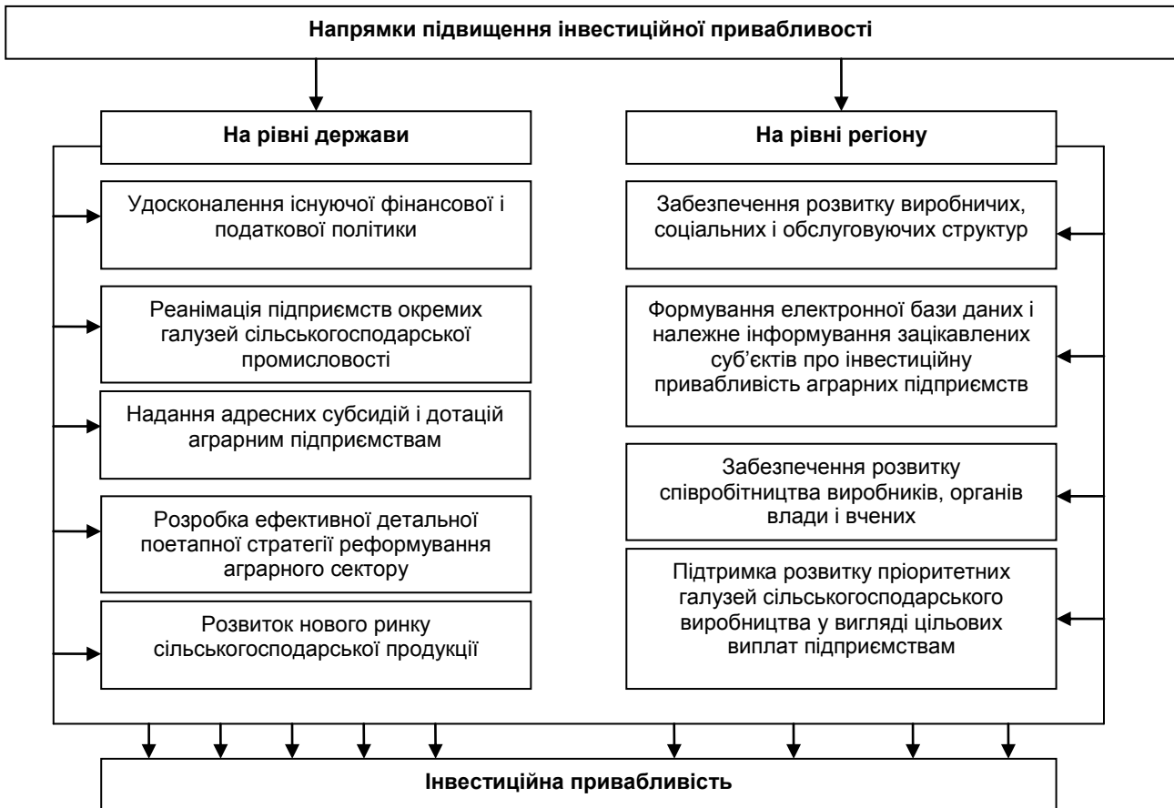
Рис. 3. Основні напрями підвищення інвестиційної привабливості аграрних підприємств на рівні держави і регіону