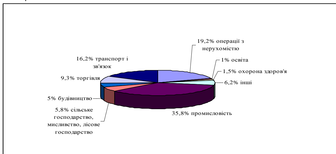
Рис. 1. Структура інвестицій в основний капітал за видами економічної діяльності у 2014 році (у % до загального обсягу)

Структура інвестицій в основний капітал за видами економічної діяльності у 2014 році зображена на рис. 1.