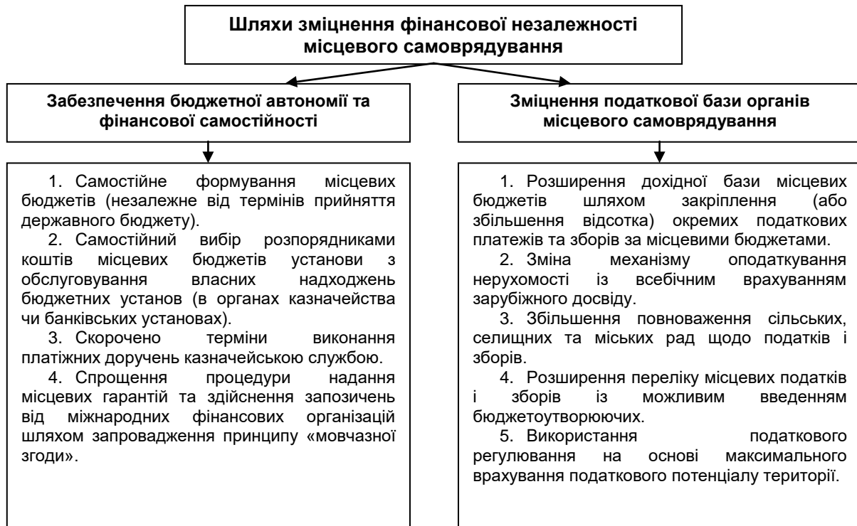
Рис. 2. Податкова складова у зміцненні фінансової незалежності місцевого самоврядування