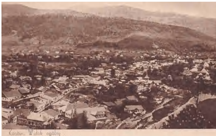
Косів, панорама, автор листівки: В. С. П., приватна колекція авторки.

Таким чином Косів та клініка Тарнавського були прорекламовані в довоєнній пресі, що було набагато ефективніше ніж звичайні оголошення, на які зрештою лікар Тарнавський не шкодував грошей й регулярно розміщував рекламу в щоденних газетах про регіональну діяльність, а також у загальнопольських (в т.ч. «Торгова Газета», «Голос Варшави», «Республіка»). Знаючи слабкість польських курортників до зарубіжних санаторіїв, підкреслював переваги Косівського району, порівнюючи його з Мераном 10 . Цьому було наукове обґрунтування, оскільки клімат Косова та околиць (Пістинь і Кути), був дуже наближений до клімату відомого тірольського курорту. Середня річна температура в Косові була 9–10°C, а в Мерані – 11°C 11 .