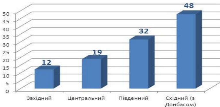
Графік 1. Індекс результативності російської пропаганди макрорегіонів України

Найбільше російська пропаганда (крім Донбасу) впливає на жителів Харківської (індекс РРП = 50) та Одеської області (індекс РРП = 43). Значно краща ситуація у Херсонській, Миколаївській, Дніпропетровській та Запорізькій областях (індекс РРП = 28-29). У Києві ситуація не відрізняється від інших територій Півночі та Центру України (індекс РРП = 19). Проте опитування вказує, що дуже серйозна контрпропагандистська робота повинна бути зосереджена у Харківській та Одеській областях.