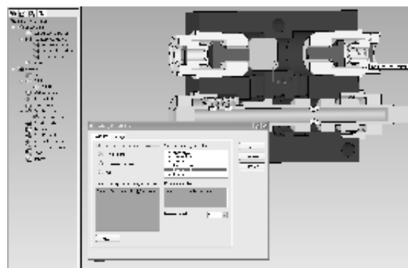
Рисунок 2 — Встановлення параметрів моделювання гідродинамічного процесу.