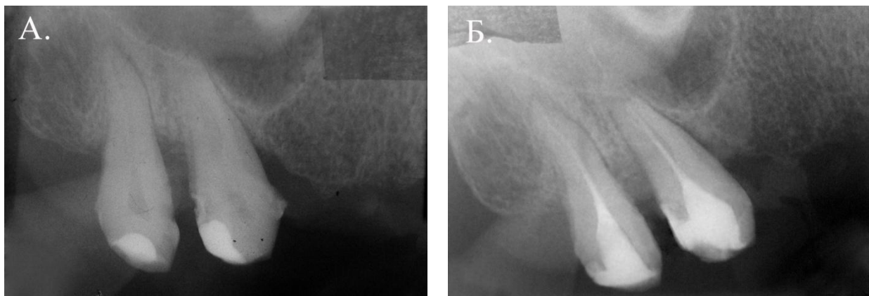
Рис. 3. Рентгенографическая картина состояния альвеолярной кости у пациента О., 48 лет во 2-й основной группе до лечения (А) и через 6 месяцев (Б). Определяется частичное восстановление утраченных ранее объемов альвеолярного отростка

Положительный результат отмечен и у пациентов в I-й основной группе, где, несмотря на отсутствие существенного прироста костной ткани,