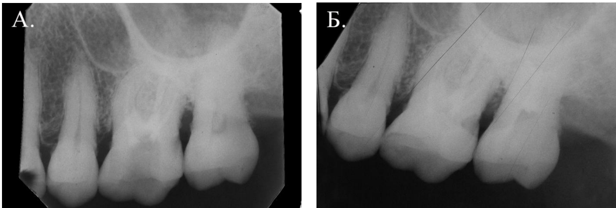
Рис. 2. Рентгенографическая картина состояния альвеолярной кости у пациента С., 42 лет в 1-й основной группе до лечения (А) и через 6 месяцев (Б). Определяется незначительное восстановление утраченных объемов альвеолярного отростка.