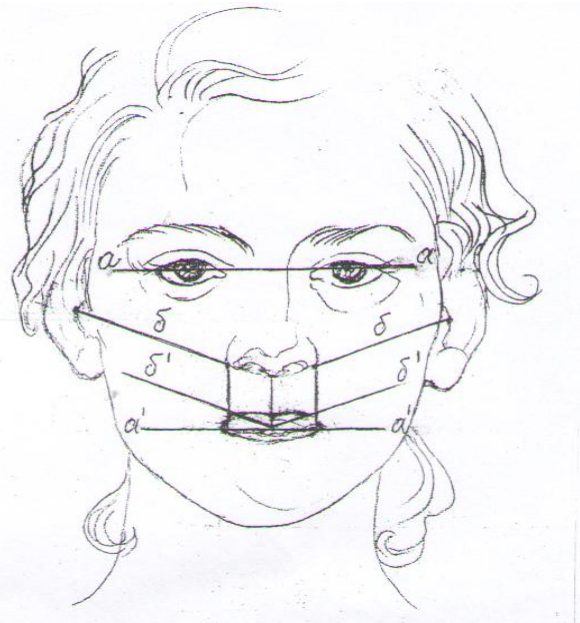
Рис. 1. Антропометрические ориентиры для построения окклюзионной плоскости: a – зрачковая линия; a' – проекция зрачковой линии; b – носо-ушная линия; b' – проекция носо-ушной линии

кали параллельно вниз до точки косметического центра ( O' ) (рис. 1), при этом образовались два встречных прямоугольных треугольника (рис. 2). Величину образовавшихся углов в точке косметического центра ( O' ) определяли при помощи транспортира. Проведено 92 измерения. Параметры отклонения проекции носо-ушной линии ( b' ) от зрачковой линии ( a' ) на уровне пересечения их линией клыков ( h ) (рис. 2) определяли по формуле h = i \times \text{tg} \alpha [1], где h - высота катета прямоугольного треугольника, i - ширина трех передних зубов, \alpha - угол пересечения проекционных линий с косметическим центром.