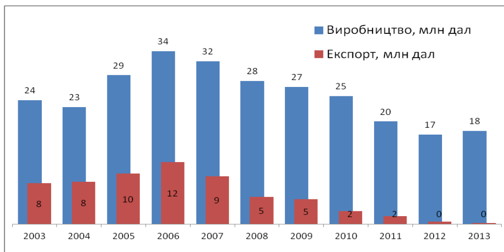
Рис.1. Виробництво та експорт спирту в Україні, млн. дал

Так, у 2011-2013 роках спирт етиловий реалізувався переважно на внутрішньому ринку, а його експорт у 2013 році становив лише 2% до рівня 2006 року (рис. 1). Це обумовлено тим, що нині за ціною вітчизняний спирт етиловий неконкурентоспроможний на світовому ринку.