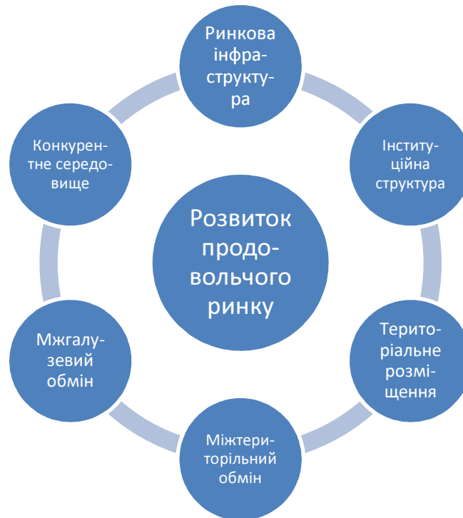
Рис. 1. Комплексне дослідження продовольчого ринку

Дослідження ринку пропонується здійснювати у такій послідовності: