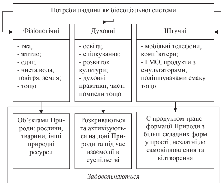
Рис. 3. Потреби та їх ресурсне забезпечення

Традиційні соціально-економічні системи передбачають життя за шаблоном «ми живемо так само, як наші сусіди». Це стосується способів і видів ведення господарства (наприклад, оранка стосується всіх виділених земель, не зайнятих будівлями та дорогами; якщо всі тримають тварин, то й власник особистого селянського господарства, що лише освоєє територію, має так чинити), способу життя, ментальності, підходів до охорони здоров'я, освіти та відтворення себе в нащадках (табл. 1). Таким чином, створюється система замкненого кола: тримаємо корову, бо всі тримають, щоб було молоко та гній; молоко продаємо, гній використовуємо, щоб виростити